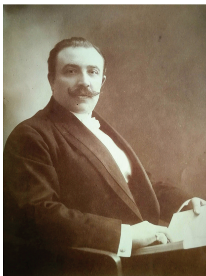
Ryc. 3. Stanisław Bursa (1865–1947)