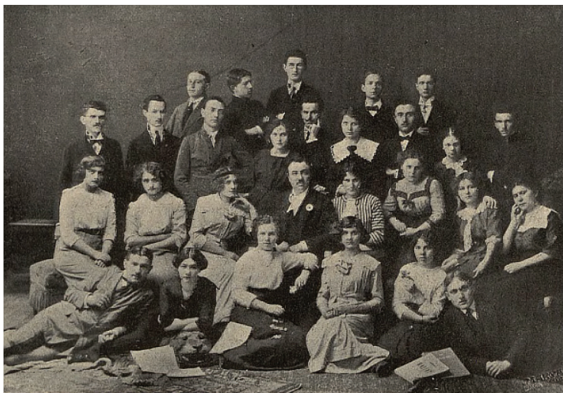
Ryc. 2. Stanisław Bursa (w środku) z grupą swoich uczniów ze Szkoły Śpiewu Stanisława Bursy