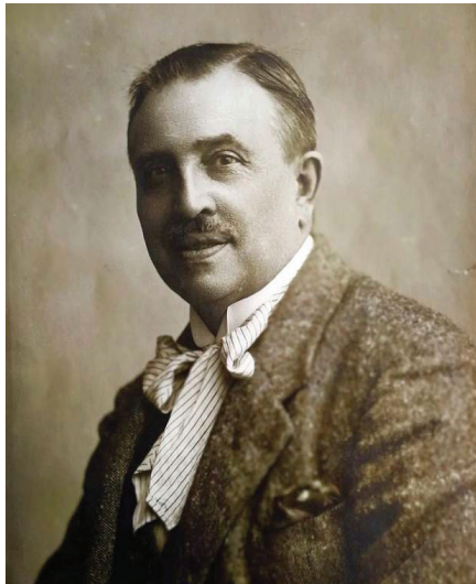
Ryc. 1. Stanisław Bursa (1865–1947)